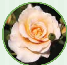
アプリコットネクター