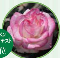
プリンセス・ド・モナコ