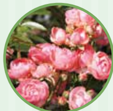
ファーザーズデイ